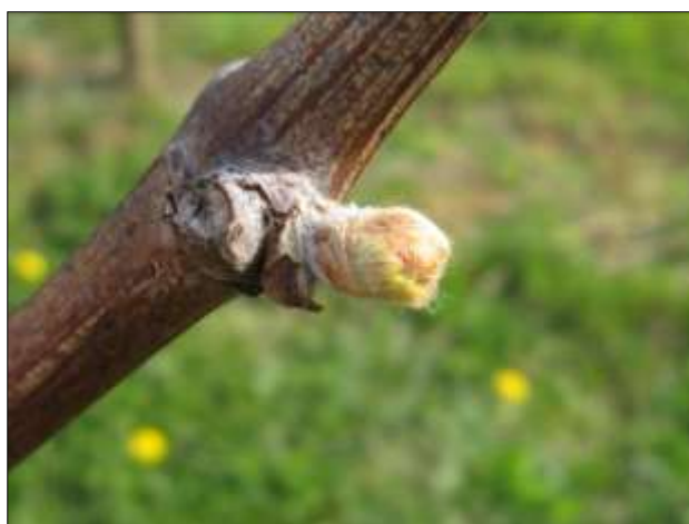
Stade phénologique 05 (pointe verte de la pousse visible) au 03 avril 2012

La vigne a rapidement démarré à la faveur des températures clémentes de ces 15 derniers jours. En moyenne sur la région Lorraine les stades phénologiques varient du stade 03 (bourgeon dans le coton) à 05 (pointe verte) sur les parcelles les plus précoces.