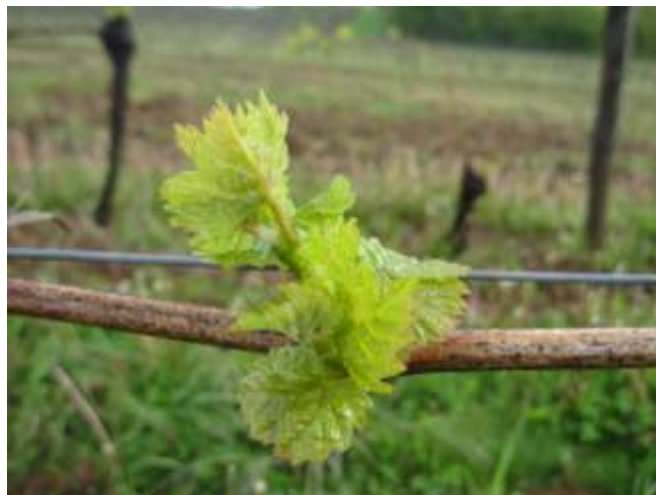
Stade phénologique 9 à 12 sur les Côtes de Moselle au 02 mai 2012

Sur la région Lorraine la situation est très variable en fonction des cépages et surtout de la localisation des parcelles.