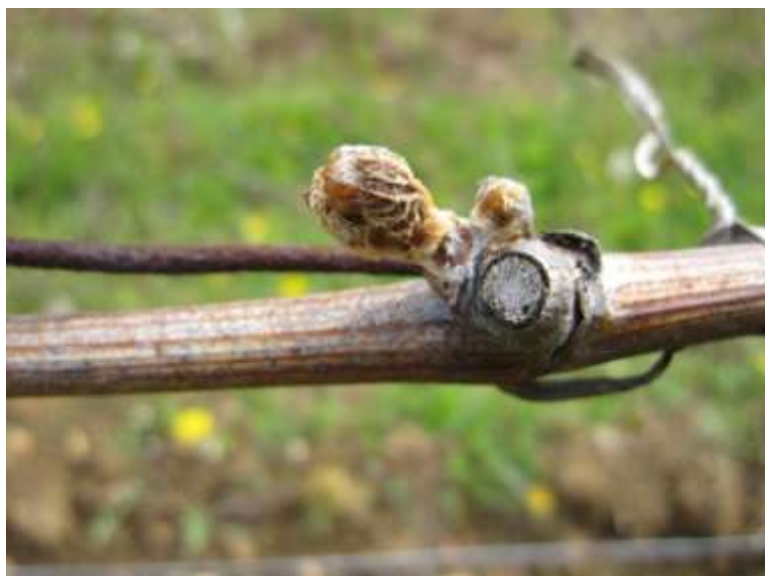
Dégât de gel sur bourgeon au stade phénologique 5 à 6 (pointe verte à éclatement des bourgeons) observé sur les Côtes de Moselle le 23 avril 2012.

Sur les parcelles de notre réseau, le pourcentage de bourgeons gelés est au maximum de 9% .