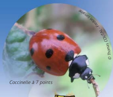
Coccinelle à 7 points