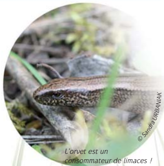
L'orvet est un consommateur de limaces !

En tant qu' auxiliaire , je suis nuisible aux nuisibles !