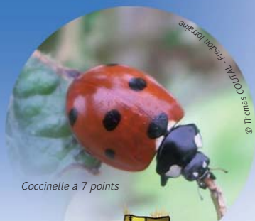
Coccinelle à 7 points